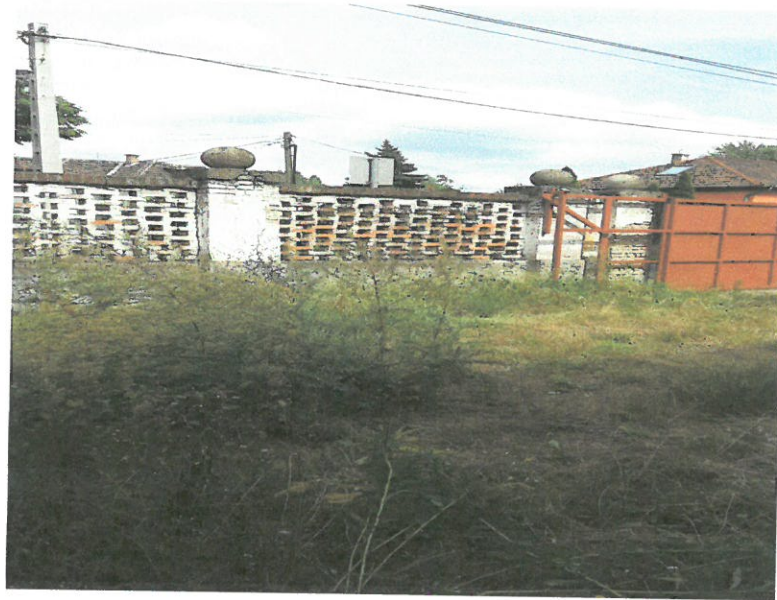
eredeti állapot 2016.07. hó