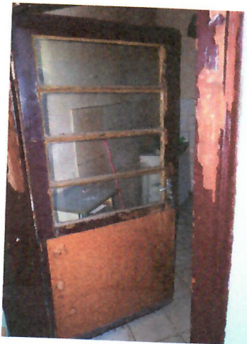
06. lakás bejárata