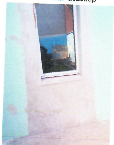
04. udvarra néző nyílászáró