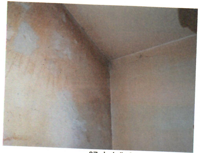
07. belső tér