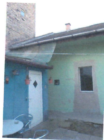
11. hullámpala a lakás bejárata felett