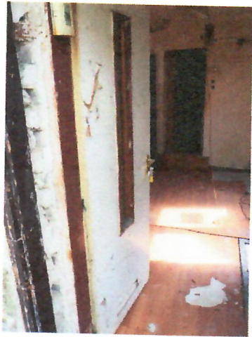
12. lakás bejárata