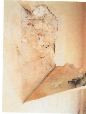
13. romos falazat