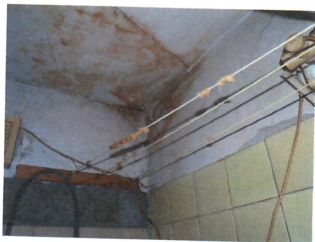
10. mennyezeti beázás