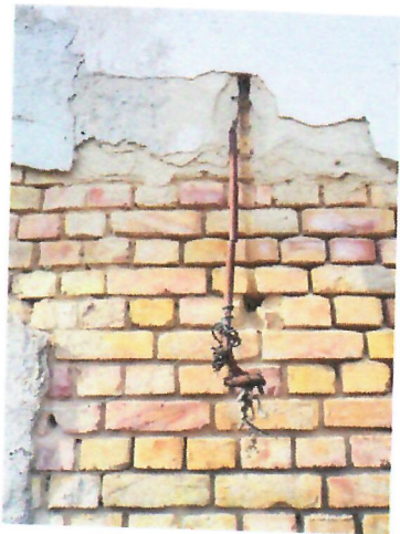
06. elektromos vezeték