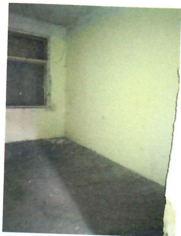
10. belső tér (2018-as kapott kép)