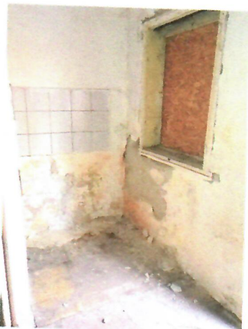
08. belső tér (2018-as kapott kép)