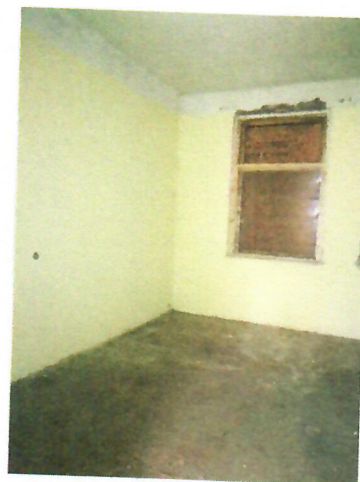
11. belső tér (2018-as kapott kép)