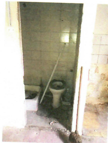
09. belső tér (2018-as kapott kép)