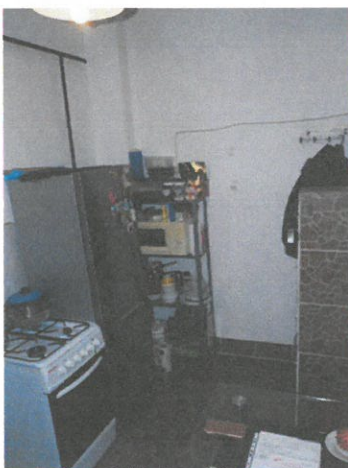
01. konyhaAz értékelt ingatlan a Népszínház és a Tolnai Lajos utca által határolt,