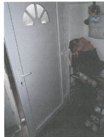
05. bejárati ajtó