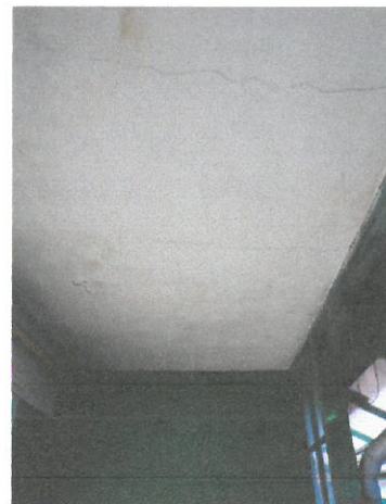
05. tornác mennyezete