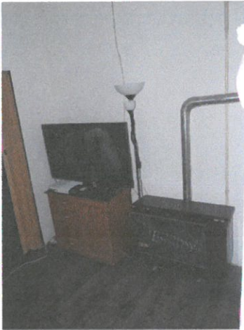
08. kéményre kötött gázkonvektor