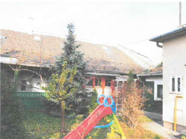
04. belső udvar