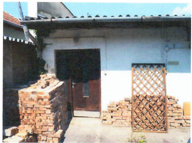
11. hátsó bejárat