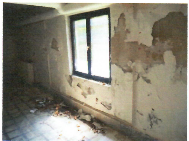
17. belső tér