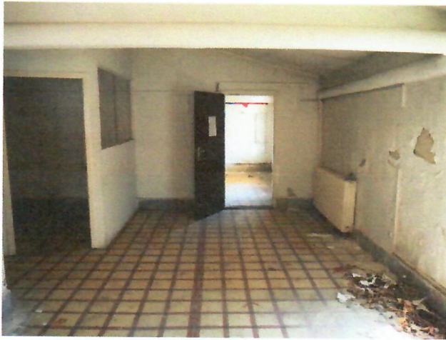
12. belső tér