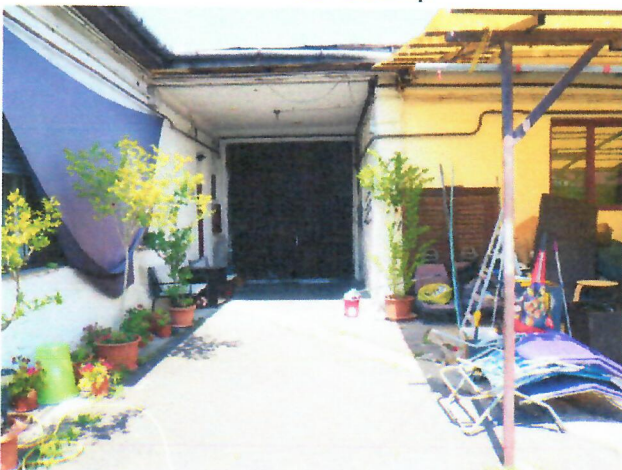
04. belső udvar