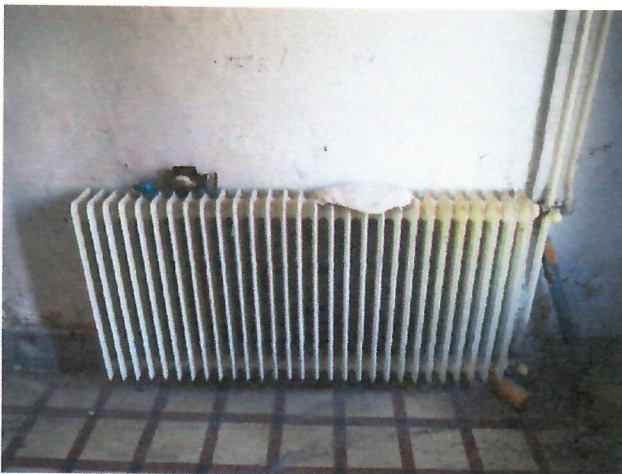
08. öntöttvas radiátor