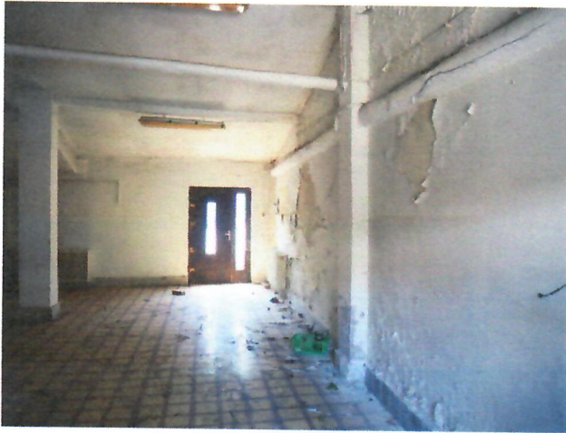
06. belső tér