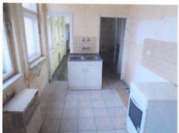
11. szolgálati lakás