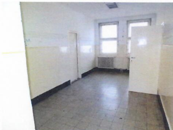
14. emeleti folyosó