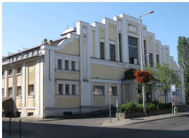
A régi csarnok már egyáltalán nem így néz ki. Kérem, nézzenek fel a homlokzatra, ha a piacon járnak!

Az épületek állaga folyamatosan romlik. Az általunk beszedett díjak legfeljebb karbantartásra és hibaelhárításra adnak lehetőséget, de komolyabb felújításokra, beruházásokra biztosan nem. Az „új csarnok” épületének legkritikusabb pontja a tető, melyet folyamatosan javítunk, felújítunk, de ennek a munkának még közel sem értünk a végére. A régi csarnok teteje és belseje is felújításra szorul, de ami biztosan nem tűr halasztást az a homlokzat és a szigetelés.