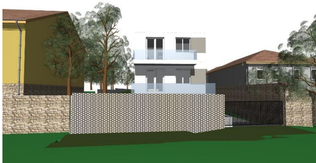
2.1 Damjanich utca 49. 4 lakásos beépítés