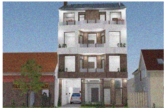
2.2 Határ út 97. lakóház