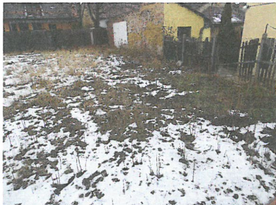
05. telek területe