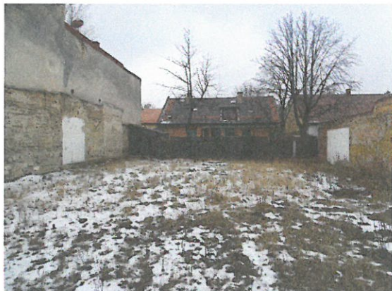
04. telek területe