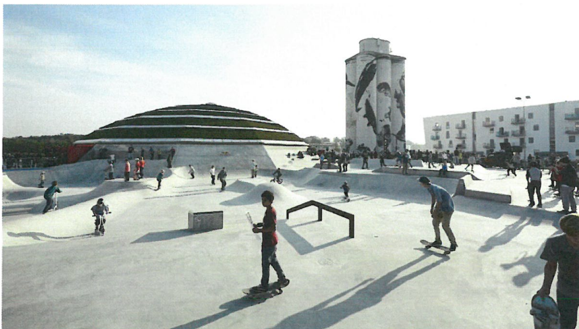
Street Dome – Kültéri hibrid gördeszkapálya - Haderslev, Dánia

Annak sincsen akadálya, hogy a pálya felületén belül akár vendéglátó, közösségi tér kerüljön kialakításra, amely megfelelő technikával akár más rendezvények (koncertek, gálák) lebonyolítására is alkalmas lehet.