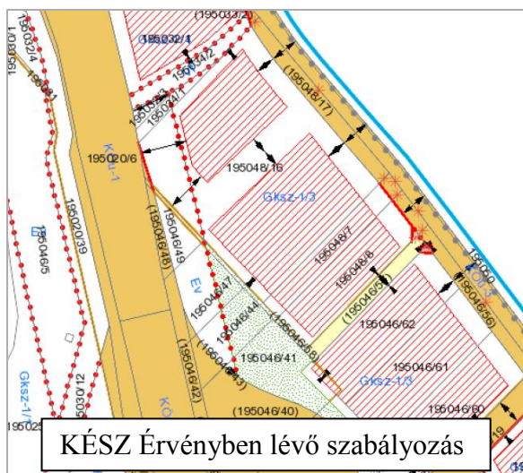
KÉSZ Érvényben lévő szabályozás