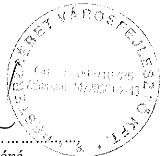
Ádovics Lászlóné ügyvezető