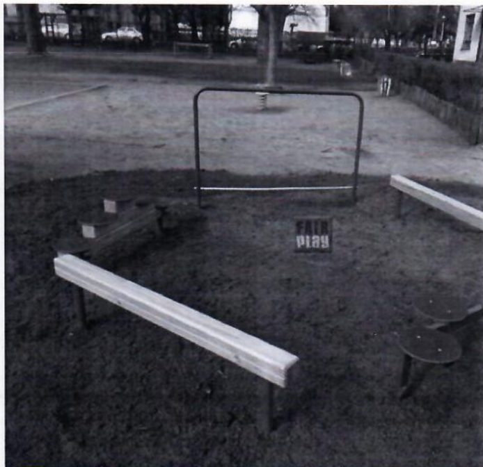
Kép 1/1 - Kombinált egyensúlyozó

Ár: 249.990 Ft (196.843 Ft + ÁFA) Cikkszám: 30106 Kapható Fair Play Pontok: 2500