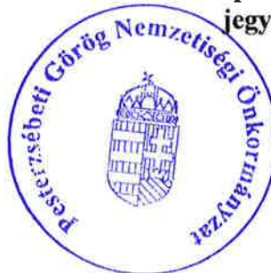
Sopisz Apostolisz Vaszilisz jegyzőkönyv-hitelesítő