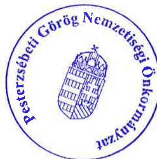
Sopisz Aposztolisz Vaszilisz jegyzőkönyv hitelesítő