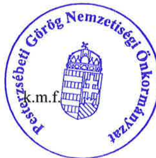
Purosz Teodor jegyzőkönyv -hitelesítő