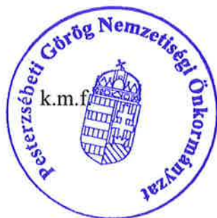
Purosz Teodor jegyzőkönyv -hitelesítő