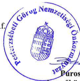
Purosz Teodor jegyzőkönyv -hitelesítő