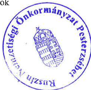
Gyuricza Norbert jegyzőkönyv-hitelesítő