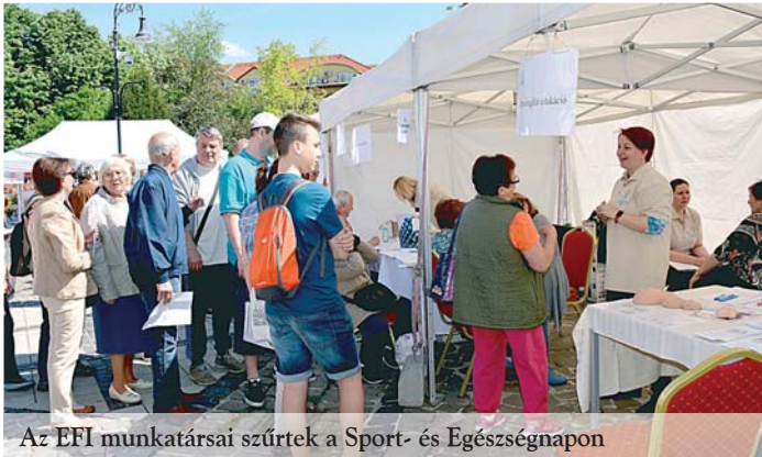
Az EFI munkatársai szűrték a Sport- és Egészségnapon

Idén március óta várja különböző és folyamatosan bővülő programokkal, klubokkal a pesterzsébeti lakosokat a Jahn Ferenc Dél-pesti Kórház által létrehozott Pesterzsébeti Egészségfejlesztési Iroda. Az alapvetően preventív céllal létrehozott iroda célja, hogy a lakosság minél szélesebb rétegét bevonja az életmódváltó és szemléletformáló programokba, ezáltal javuljon a kerület lakosságának egészségi állapota, valamint hozzájáruljon a születéskor várható élettartam és az egészségben eltöltött évek számának növekedéséhez.