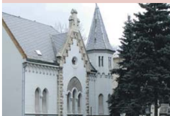
Pesterzsébeti Múzeum 1201 Budapest, Baross u. 53. Tel./fax: 06 (1) 283-1779 Nyitva tartás: Hétfő-Péntek 10-18