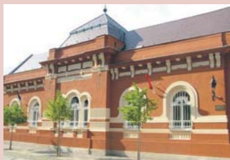
Gaál Imre Galéria 1203 Budapest, Kossuth Lajos u. 39. Tel.: 06 (1) 283 0031 Nyitva tartás: Kedd-Szombat 10-18