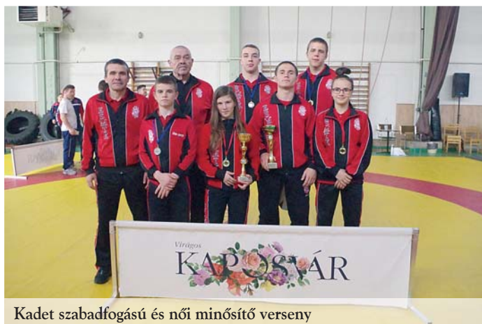
Kadet szabadfogású és női minősítő verseny

Április 7-én, Kaposváron rendezték meg a kadet lányok és szabadfogású birkózók minősítő versenyét. Szakosztályunk a két szakág küzdel-