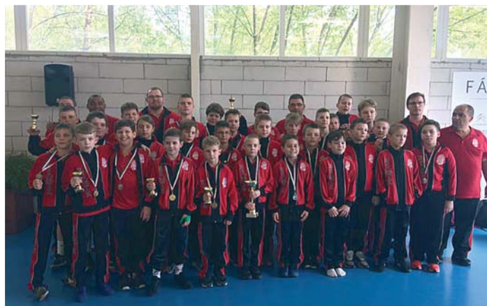
Diák I-II. szabadfogású Budapest Bajnokság